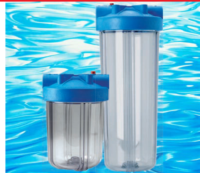
Portacartuchos ó Portafiltros

Los portacartuchos Big Blue son compatible con una amplia variedad de químicos y están disponibles con o sin liberador de presión.